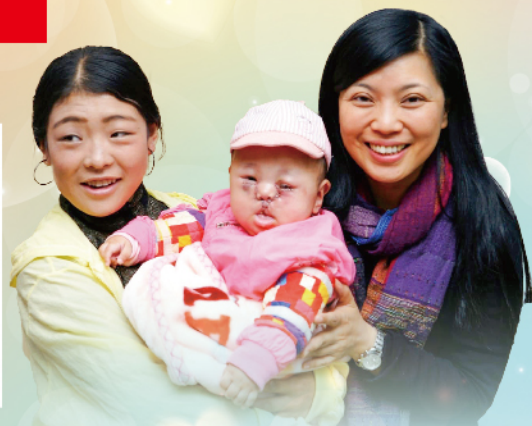
2019年媽媽與剛完成手術的剛強B