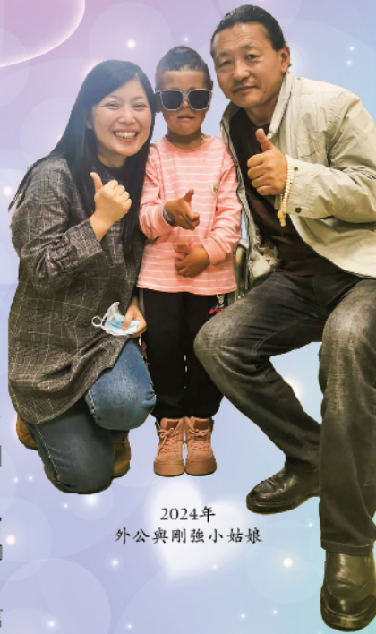
2024年 外公與剛強小姑娘

各位，『你手若有行善的力量，不可推辭，就當向那應得的人施行。』或許，今天你所作的未必立即看到成果，但日子過去，主必叫你所付出的發生功效！RMB3,000元就可以幫助一例家境困難的小朋友重點信心微笑的希望，請即響應2024年房角石籌款活動！