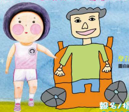
Little Half 小半